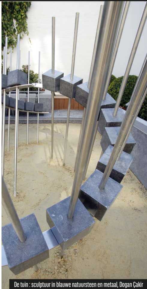
De tuin : sculptuur in blauwe natuursteen en metaal, Dogan Çakir

In 2008 werden grote werken ondernomen om het prachtige pand te renoveren en te moderniseren maar tegelijkertijd de oorspronkelijke en historische architecturale kenmerken te behouden. Binnen vinden we een aantal salons en eetzalen verdeeld over twee verdiepingen, waartoe we via een brede, centrale trap toegang hebben. Elke verdieping ademt een eigen tijd en stijl uit door de keuze van het meubilair en de binnenhuisdecoratie.