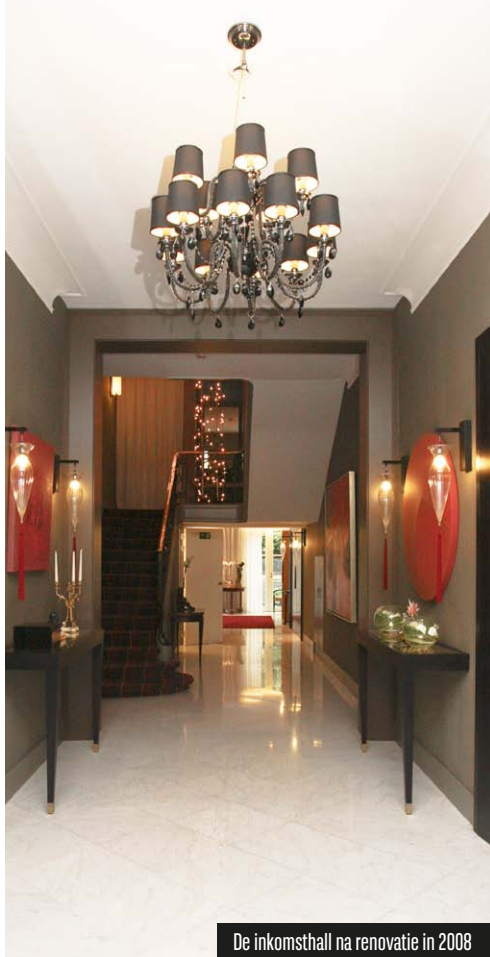
De inkomsthal na renovatie in 2008