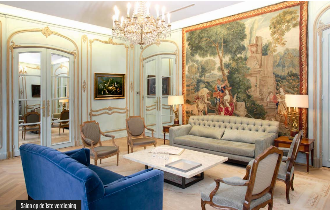
Salon op de 1ste verdieping

De kunstwerken in het Maison Ducale zijn belangrijke stukken uit de collectie die in de loop der tijd werd aangekocht door de verschillende