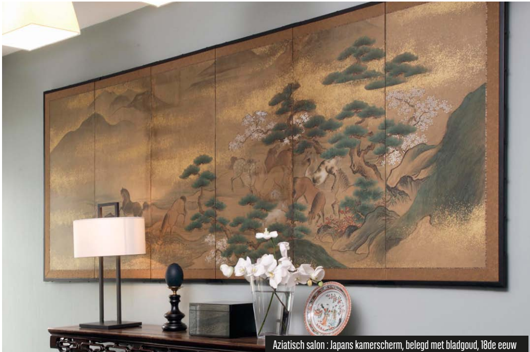
Aziatisch salon : Japans kamerscherm, belegd met bladgoud, 18de eeuw

door meerdere eeuwen van artistieke creaties, van de Vlaamse meesters uit de 17e eeuw tot jong talent uit de 21e eeuw. Ze geven het Maison Ducale een originele artistieke dimensie en bijzondere sfeer.