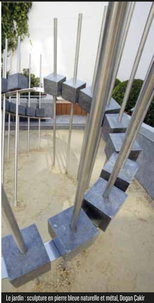
Le jardin : sculpture en pierre bleue naturelle et métal, Dogan Çakir

En 2008, d'importants travaux sont entrepris en vue de remettre cette magnifique demeure en état et de la moderniser tout en préservant ses caractéristiques architecturales originelles et historiques. L'espace intérieur s'articule autour de plusieurs salons et salles à manger sur deux étages, auxquels on accède par un large escalier central. Chaque niveau reflète une époque et un style distincts en fonction du choix du mobilier et de la décoration intérieure.