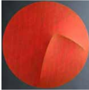
Photo de couverture : Entrée principale de la Maison Dieckx - Photo : Abens de couverture : Lost Balls - Michel Mouffe - 2009. Technique mixte sur toile, diamètre 115 cm, © SABAM Belgium 2012 - BNP Paribas Fortis - Imprimé sur papier issu de forêts gérées durablement - 2012