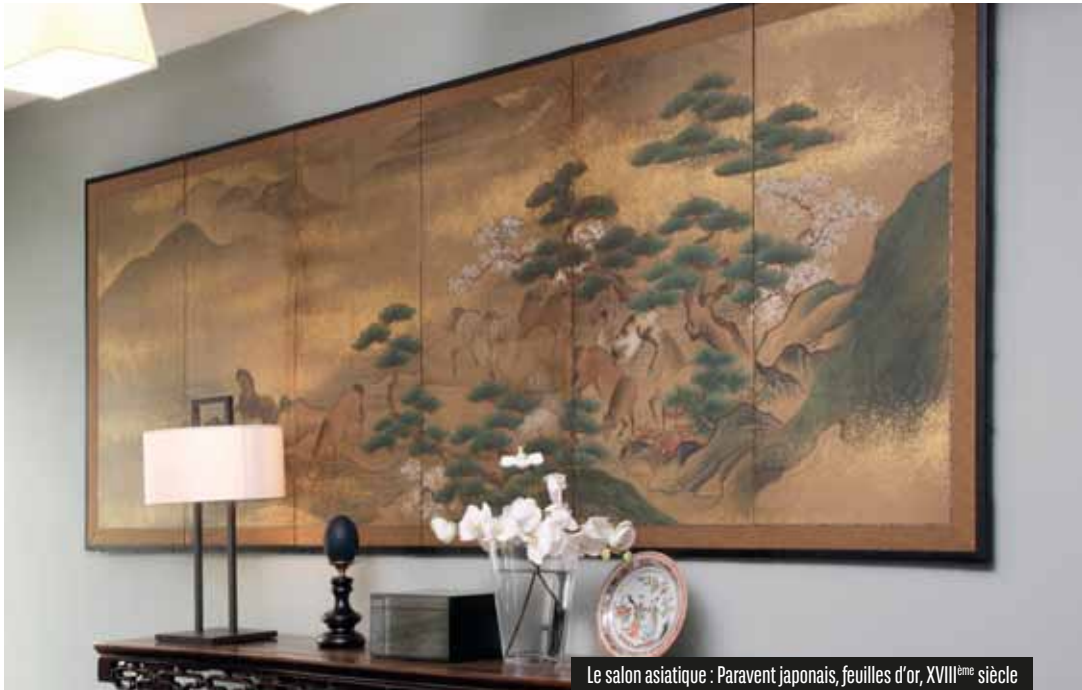
Le salon asiatique : Paravent japonais, feuilles d'or, XVIII ème siècle

travers plusieurs siècles de création artistique, des maîtres flamands du XVII e siècle aux jeunes talents du XXI e siècle. Elles confèrent une dimension culturelle originale et une âme particulière à la Maison Ducale.