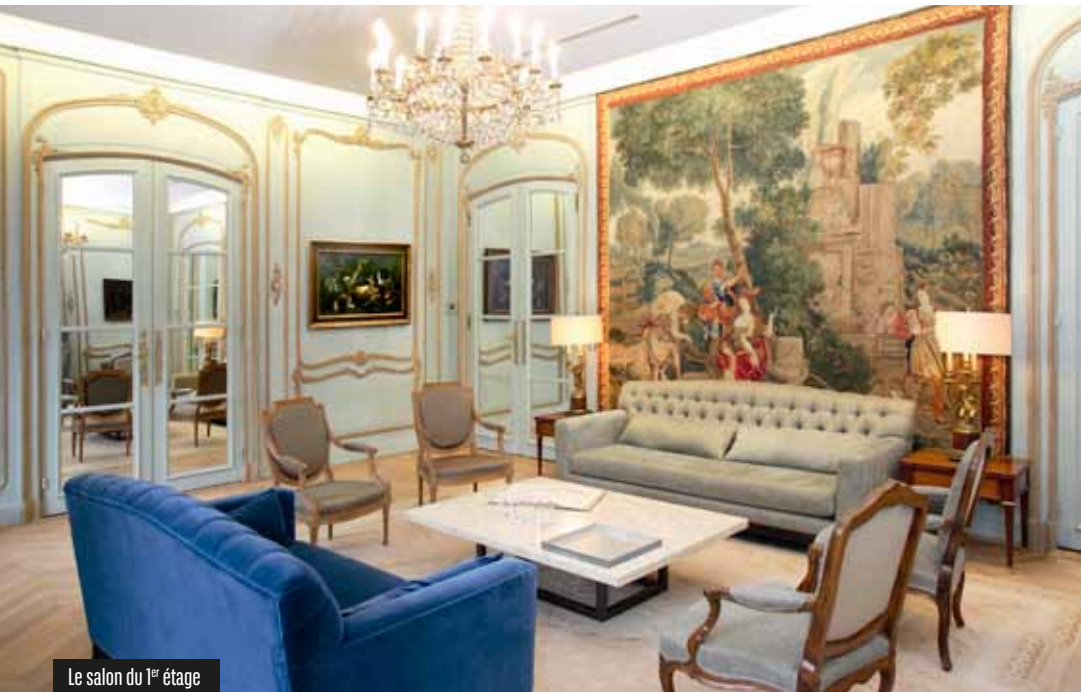
Le salon du 1 er étage

Les œuvres d'art rassemblées au sein de la Maison Ducale sont des pièces significatives de la collection