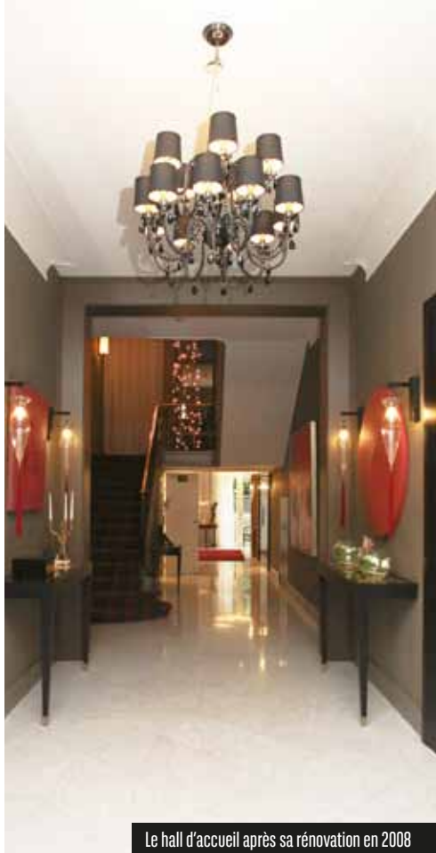
Le hall d'accueil après sa rénovation en 2008

La rue Ducale , dont les plans sont dressés par l'architecte urbaniste français Barnabé Guimard , rappelle par son nom que cet endroit a appartenu pendant de longs siècles à la Cour ducale des ducs de Brabant et de Bourgogne. Elle forme, avec la rue Royale, la rue de la Loi et la place des Palais, le quadrilatère qui encadre le Parc de Bruxelles, jardin public dessiné en 1774 par Joachim Zinner , architecte paysagiste autrichien et jardinier de la cour Austro-Hongroise .